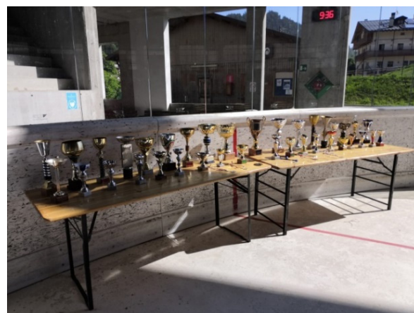
Le coppe delle nostre olimpiadi