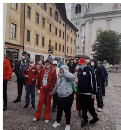
In passeggiata a Cortina