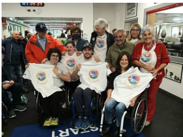
A Cortina con gli atleti paraolimpici