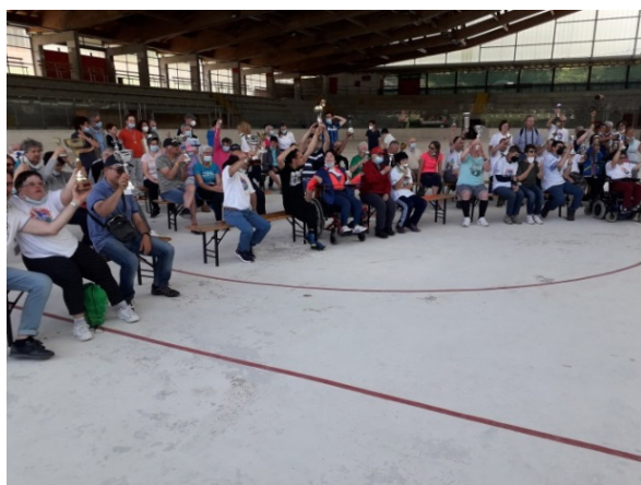
Le premiazioni alle nostre olimpiadi