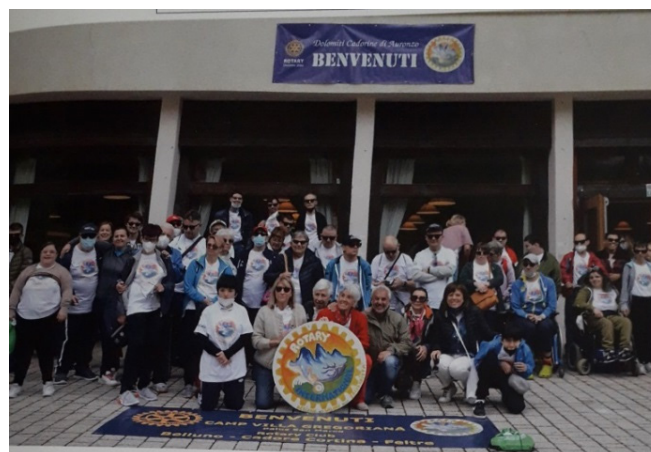
Il gruppo dei ospiti e dei volontari